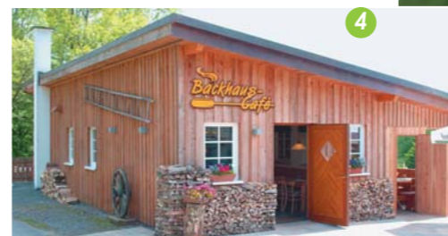
© Kreisstadt Olpe 2017, Facharbeitsteam Landwirtschaft der Lokalen Agenda 21 Olpe Anne Gerlach, Berndt Högermeyer, Sabine Melzer-Baldus . Layout: Jutta Korte