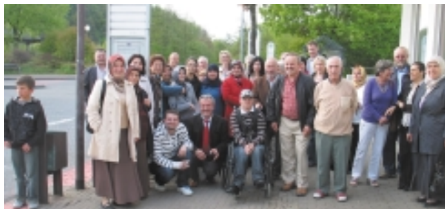
Wir wollen uns