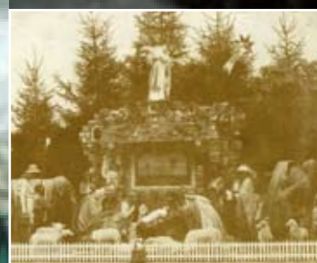
Foto unten: Weihnachtskrippe der St.-Martinus-Kirche in Olpe (um 1910)

Erst Ende des 18. Jahrhunderts fanden Krippen Eingang in den privaten Bereich und wurden hier schließlich zu einem wesentlichen Bestandteil vor allem der katholischen Weihnachtsfeier. Krippen wurden und werden seitdem in allen künstlerischen Stilen und Materialien (z.B. Papierkrippen) her- und ausgestellt.